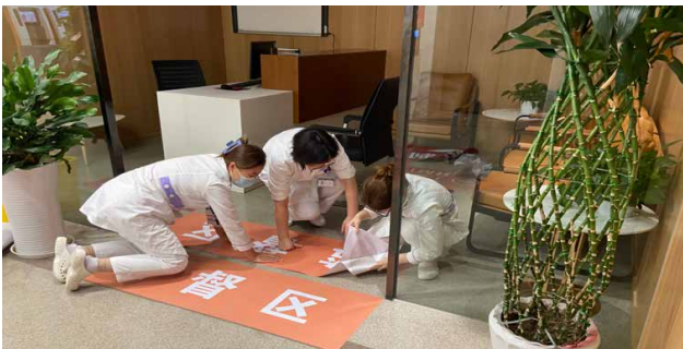
（插图：张贴核医学区域划分的地标）